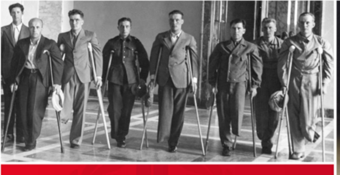
Kriegsversehrte in Finnland. (8)

Die Schweiz müsste alles tun, damit in Zukunft nicht wieder Kriege Zehntausende oder Hunderttausende Menschen töten, verwunden, zu Flüchtlingen und zu Invaliden machen. Das heißt: Stopp der Kriegsmaterialexporte und Waffenschiebereien von der Schweiz aus. Stopp der Finanzierung von Rüstungskonzernen durch den Finanzplatz Schweiz.