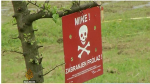
Minen! Verbotener Durchgang!