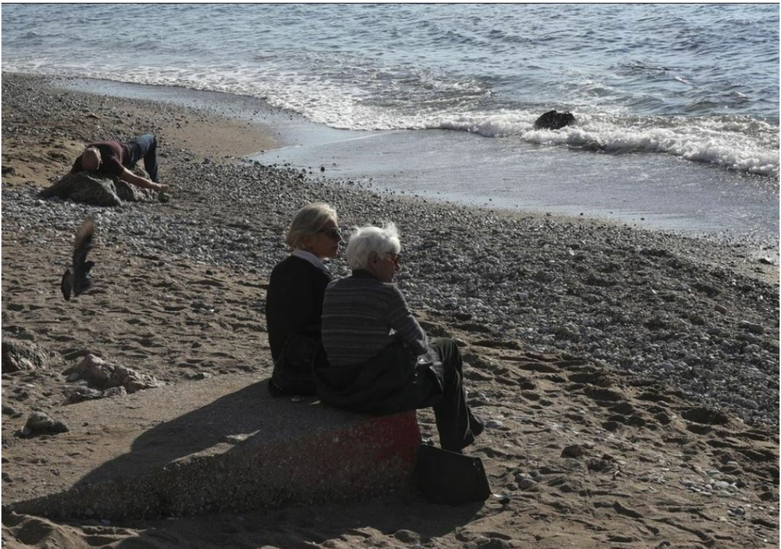
Deutsche 2022 in Griechenland