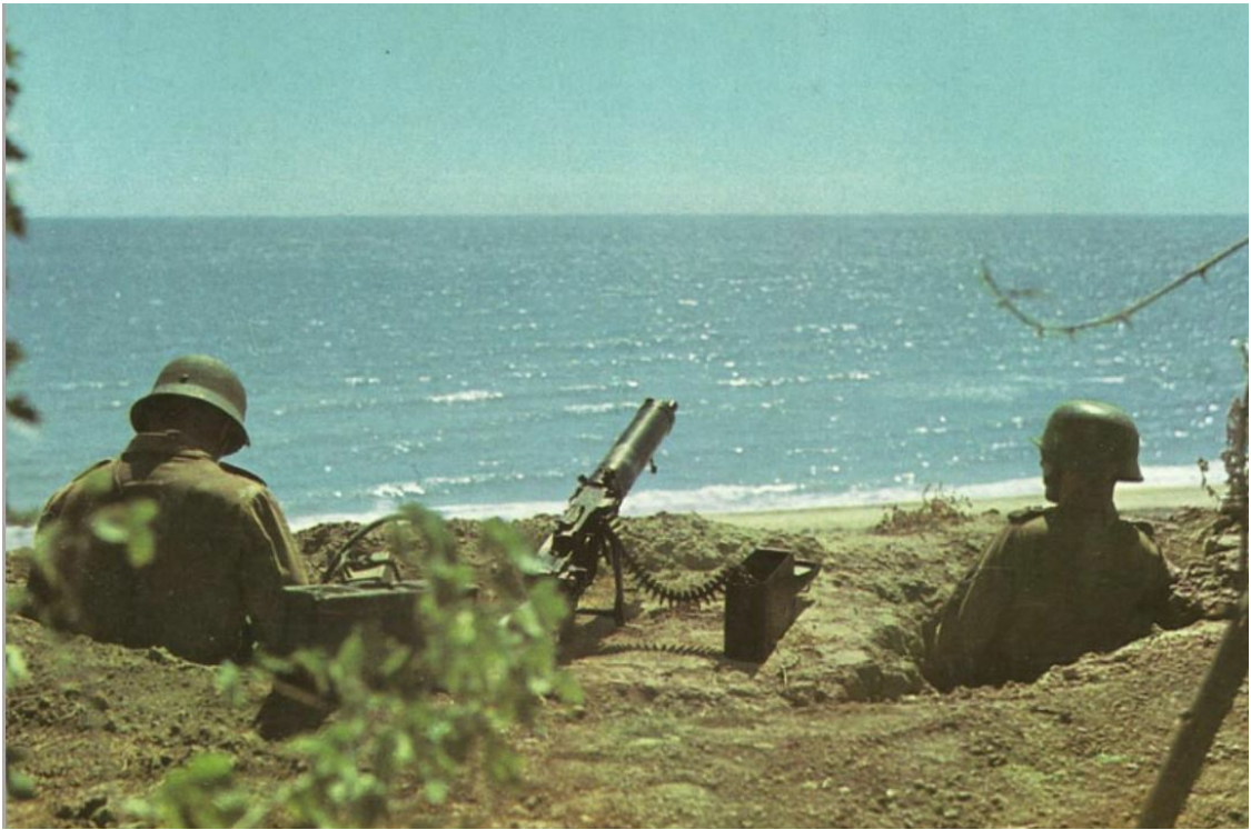
Deutsche 1941 in Griechenland.