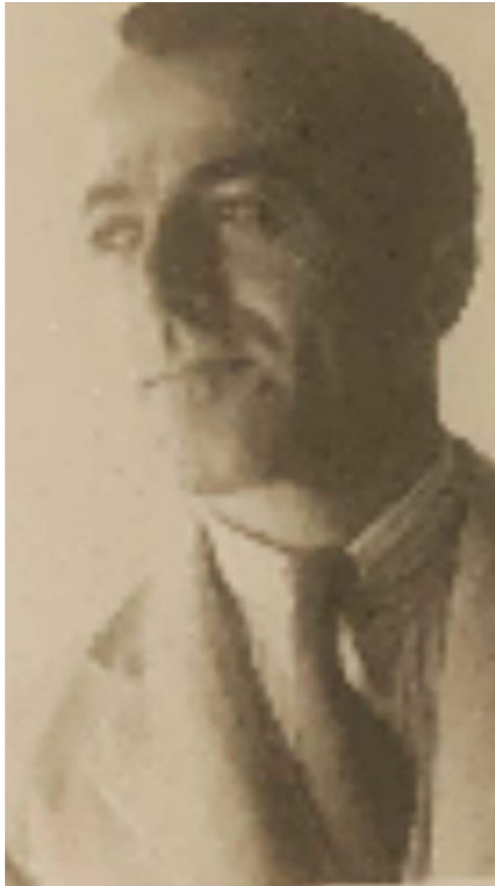
Foto des Vaters von Antoun Ananias

Ihr Vater war der geheimnisvollste Mann, den Sie je kannten. Obwohl Sie jahrelang mit ihm gesprochen haben, sagen Sie: