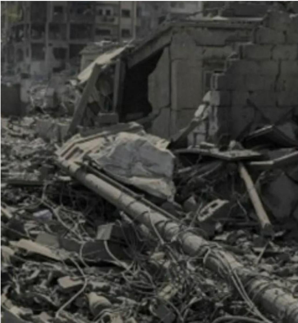
So sieht das Wohnviertel des Befragten in Gaza heute aus