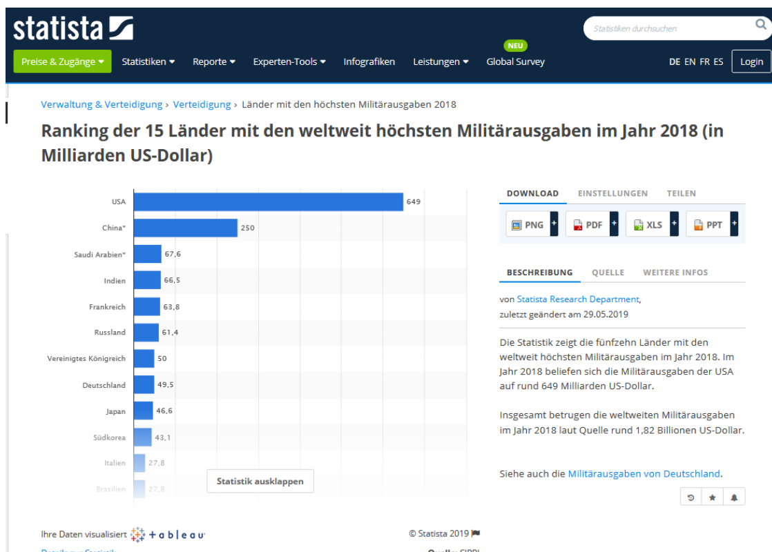
Bild 2: Ranking der 15 Länder mit den weltweit höchsten Militärausgaben im Jahr 2018 in Milliarden US-Dollar)

Soso! China gebe also so viel für Militär aus, also muss es ja eine Eskalation planen. Diese Prämisse mag ja durchaus plausibel sein. Aber zu welcher Konklusion kommt man dann, wenn man die Militärausgaben Chinas mit denen der USA (19) und den etwa 1.000 US-Militärbasen außerhalb der Vereinigten Staaten (20) gegenüberstellt?