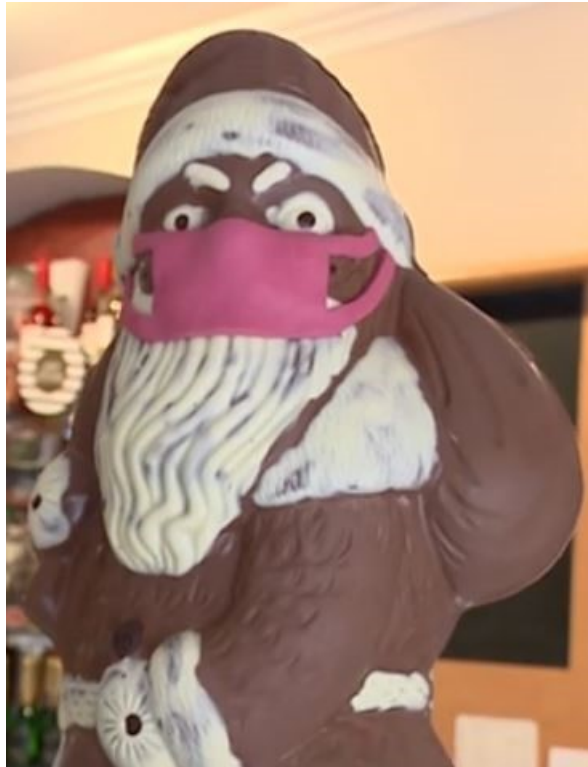
Abbildung 1: Der böse dreinblickende „Maskolaus“. Das Gesicht wirkt unfreundlich und vielmehr so, als würde er sagen wollen: „Kinder! Wenn ihr nicht artig seid und eure Maske nicht tragt, dann kommt der Krampus zu euch, nimmt euch mit und tötet eure Großeltern.“

Der Shitstorm im Netz ließ nicht lange auf sich warten. Zahlreiche Kommentatoren ließen ihrer Empörung über diese Aktion in den Kommentarspalten unter dem Facebook-Post der Konditorei freien Lauf, echauffierten sich einerseits über die Verschandelung der „heiligen Figur“ des Nikolaus und andererseits über die bereitwillige Übernahme des Corona-Faschismus-Symbols zu dem Zweck, das eigene Weihnachtsgeschäft anzukurbeln. Manche wünschten dem Konditor sogar die Insolvenz.