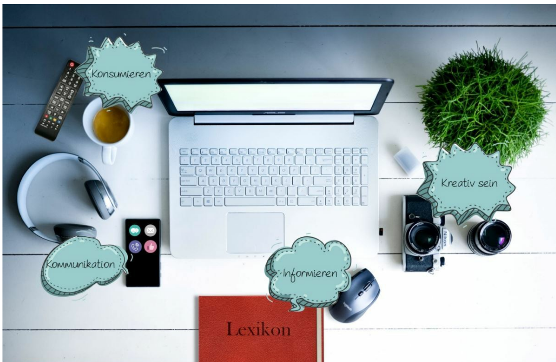
Bild 2: Vorschlag für den Startbildschirm der öffentlich-rechtlichen Medien-Plattform auf PC, Handy oder Smart-TV

Neben den Bürgern sollen die öffentlich-rechtlichen und privaten Medien, Zeitungen, Organisationen, Vereine und Parteien in dieser Plattform vertreten sein. Gleichzeitig bleibt für diejenigen, die ihren Medienkonsum nicht ändern wollen, alles so, wie sie es bereits kennen, indem sie nur einen kleinen Ausschnitt der Möglichkeiten nutzen. Der Startbildschirm der Plattform könnte für Nutzer von PC, Handy oder Smart-TV, also Geräten mit Rückkanal, zum Beispiel wie in Bild 2 gezeigt aussehen.