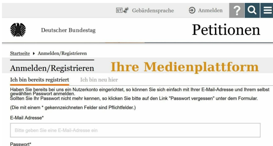
Bild 3: Vorschlag zur Registrierung für die öffentlich-rechtliche Medien-Plattform über den Zugang Bundestag – Petitionen (Grafik: modifizierter Screenshot, Volkmar Kreiß)

Ebenso kann einfach auf Publikumsbeschwerden reagiert werden. Publikumsbeschwerden werden von allen Nutzern gesehen und können wiederum bewertet und somit gewichtet werden. Die gesetzliche und technische Basis der Plattform sind das Grundgesetz, der Medienstaatsvertrag und der Pressekodex sowie die heutigen technischen Möglichkeiten, zum Beispiel die verfügbaren Serverkapazitäten, Musik-, Sprach- und Bildfilter. Die Regeln zur Benutzung sind so einfach wie die Regeln im Straßenverkehr. Es wird alles möglich sein, was Recht und Gesetz in der Bundesrepublik erlauben. Jeder Einzelne kann aktiv werden, und jeder ist eingeladen, sich einzubringen – ob als Sender, Kritiker oder auch als Whistleblower.