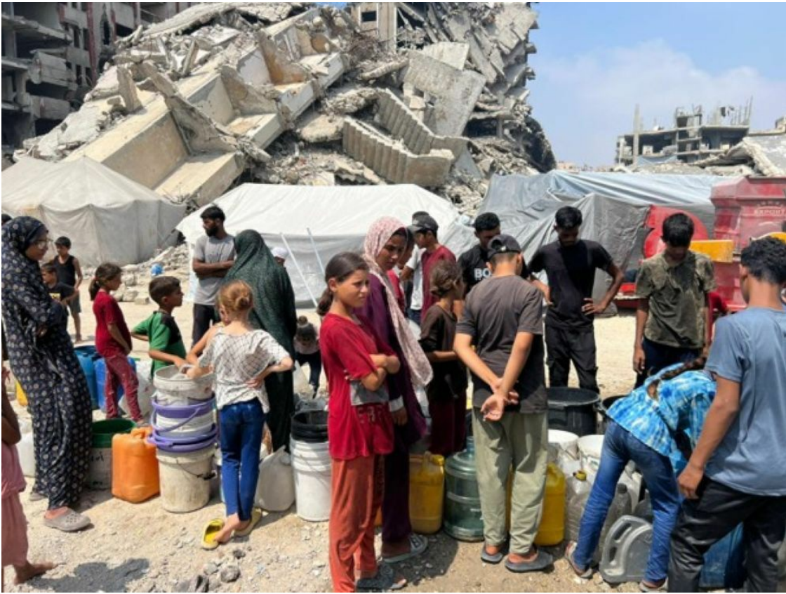
Anstehen für Wasser — Alltag in Gaza.

Barakat sagt, während er sich den Schweiß aus dem Gesicht wischt in der brütenden Sommerhitze gegenüber Zeitpunkt: