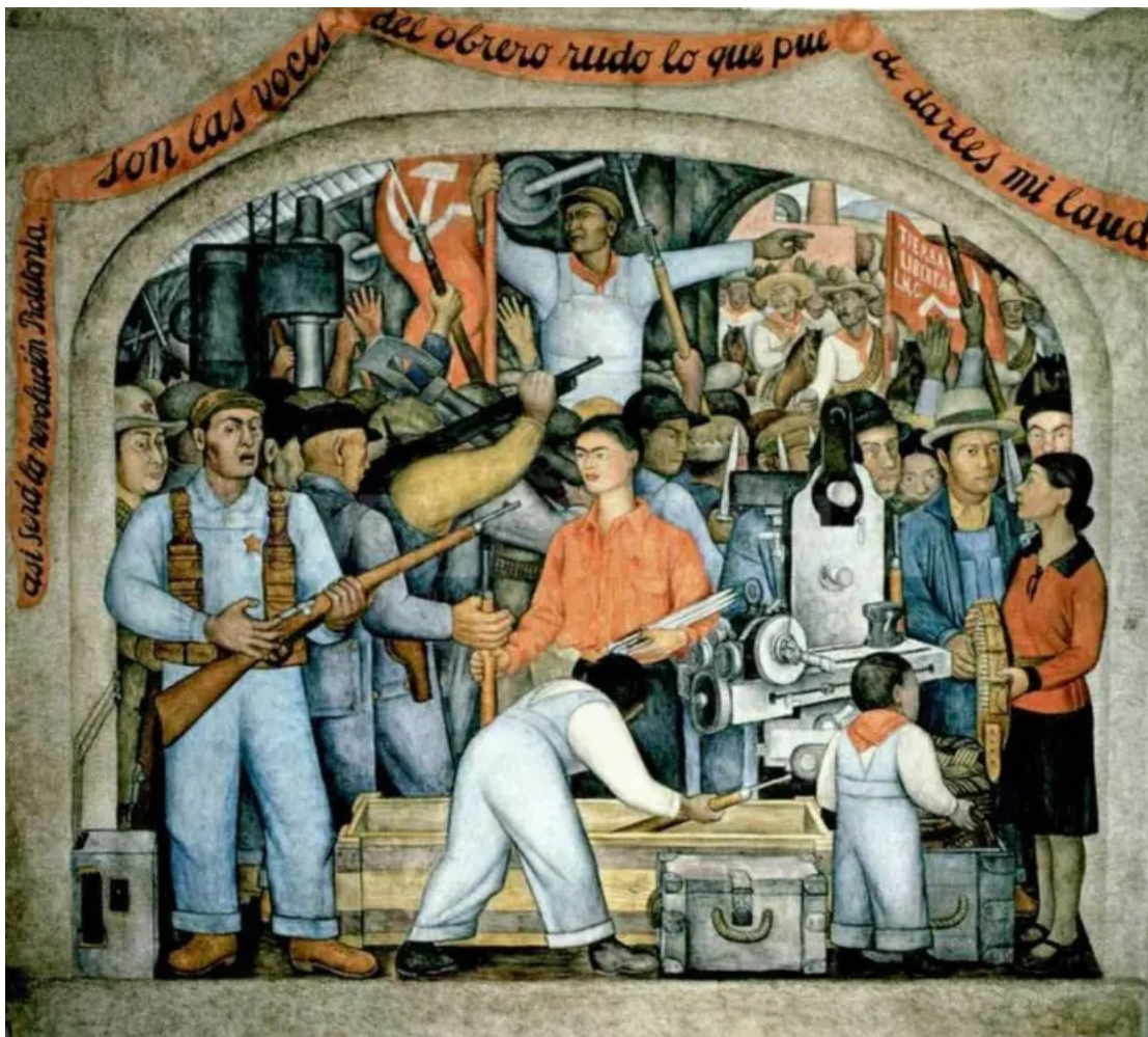
The Arsenal, 1928, Diego Rivera

In dem Maße, in dem wir uns in den sozialen Medien bewegen, in dem wir unsere Identität in ihrem Rahmen präsentieren und in dem wir mit genetischen Medikamenten behandelt werden, um unsere körperliche Reaktion auf die natürliche Welt zu verändern, sind wir bereits in eine gefährliche Phase eingetreten, die sehr wohl das Ende unserer Spezies, wie wir sie kennen, bedeuten könnte.