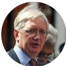
Craig Murray , Jahrgang 1958, ist ehemaliger britischer

Dieser Artikel erschien bereits auf www.rubikon.news .