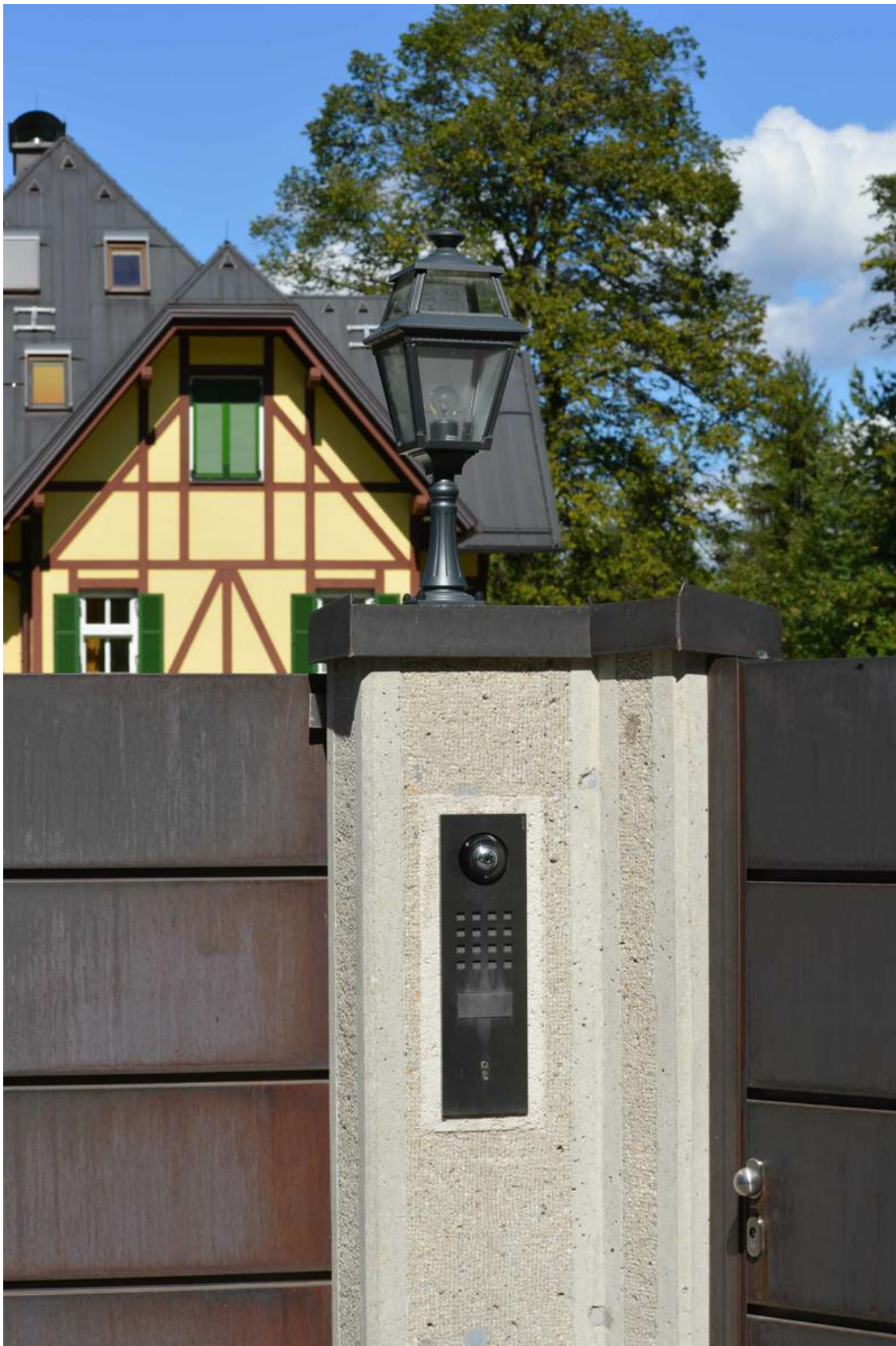
Die Porsche-Villa am Wörthersee