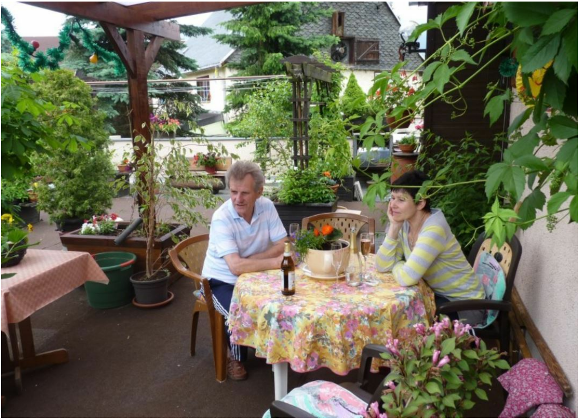
Meine Mutter und mein Opa in unbeschwerten Zeiten