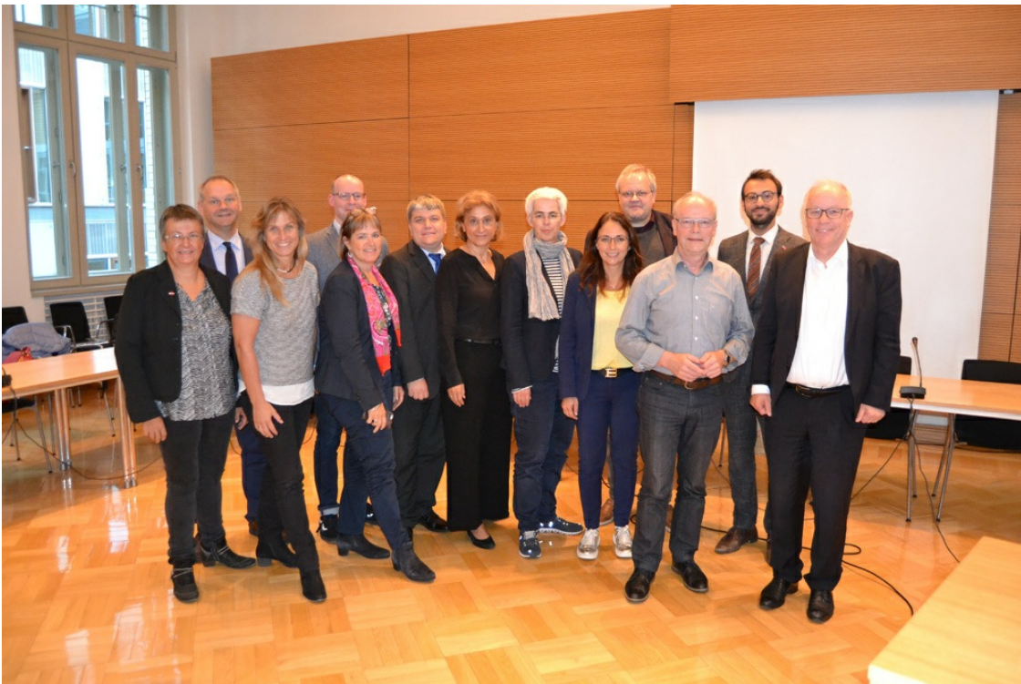
Bild 1: Parlamentskreis Atomwaffenverbot Auftakt Gruppenbild.