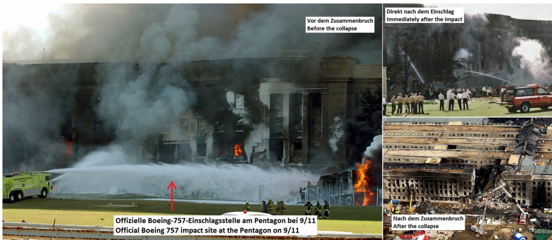
Bild 4: Amtliche Boeing-757-Einschlagsstelle in Arlington am Pentagon bei 9/11. Foto oben rechts: Direkt nach dem Einschlag, US Navy (11). Foto links: Kurz vor dem Zusammensturz mit offizieller „quadratischer“ Einschlagstelle in der unteren Mitte des Bildes, US Marine Corps, Wikimedia (12). Foto unten rechts: Nach dem Zusammenbruch, US Air Force, Wikipedia (13).

mit dem kleinen Krater in der Mitte dieses Fotos. Man beachte die beiden Menschen mit den weißen Hosen, die neben dem links in Großaufnahme zu sehenden Krater stehen. Dieses Mini-Loch kann niemals die Einschlagstelle einer Passagiermaschine sein.