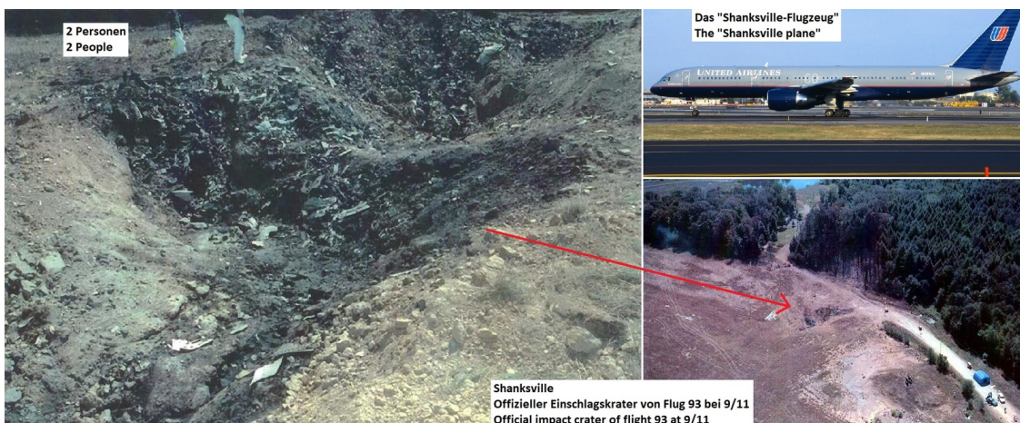
Bild 3: Offizielle Absturzstelle von Flug 93 auf dem Feld in Shanksville, Pennsylvania, 11. September 2001. Der links in Großaufnahme zu sehende Krater ist im rechten unteren Foto genau in der Mitte zu sehen. Die beiden Fotos wurden von US-Behörden hergestellt und sind Public Domain, beispielsweise bei Wikipedia und Wikimedia erhältlich (7 bis 9). Rechts oben das „Shanksville-Flugzeug“ drei Tage vor seiner Entführung, Wikipedia (10).

Dass den Regierenden „der Arsch auf Grundeis geht“ vor dem nahenden 20. Jahrestag der Terrorattacken des 11. September 2001 in Shanksville, Arlington/Pentagon und New York/WTC dürfte angesichts folgender, von US-Behörden gemachter Fotos klar sein, bei denen wirklich jeder Idiot auf den ersten Blick sehen kann, dass die offizielle Theorie bizarrer Schwachsinn ist und völlig selbst den billigsten und banalsten Grundlagen der Physik widerspricht (6). Dass die niederen Ränge ganz einfach ihre Arbeit tun, lässt sich oft nicht umfassend verhindern oder vertuschen.