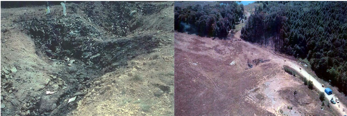
Bild 1: Offizielle Absturzstelle der Boeing 757 in Shanksville.

Die heutige Zeit wird von den Terroranschlägen des 11. September 2001 – 9/11 – und den daraus abgeleiteten Unterdrückungsmaßnahmen gegen die eigene Bevölkerung geprägt sowie von den Konflikten und Kriegen mit oftmals hunderttausenden Toten (1, 2). Bei dem 9/11-Ereignis selbst wurden vier Verkehrsflugzeuge entführt und 3.000 Menschen starben. Das folgende Bild zeigt die offizielle Absturzstelle eines der Flugzeuge, der Boeing 757 von United Airlines Flug 93: