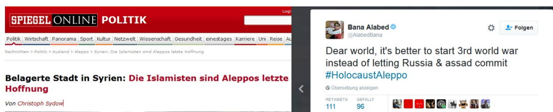
Bild: Spiegel Online feuert Al-Qaida-Einheiten an: „Die Islamisten sind Aleppos letzte Hoffnung“, ein

Und es geht noch bizarrer: Im aktuellen Syrienkrieg – und in weiteren Konfliktgebieten – arbeiten die USA und ihre Verbündeten mit Al Qaida zusammen. Mit jener Terrororganisation also, die für die Terroranschläge des 11. September 2001 in den USA – samt Shanksville-Erdloch – verantwortlich sein soll (15). Während man in Pressekonferenzen und Reisewarnungen zugibt, dass hier Al Qaida federführend aktiv ist, verkauft die Propaganda die „pro-westlichen“ Terroristen und Söldner als „moderate Rebellen“ (16 bis 18).