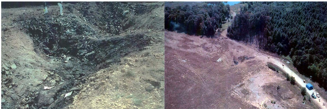
Bild 1: Offizielle Absturzstelle der Boeing 757 in Shanksville. Die Fotos wurden von US-Behörden hergestellt und sind daher unter Public Domain frei verfügbar (3, 4).

Die heutige Zeit wird von den Terroranschlägen des 11. September 2001 – 9/11 – und den daraus abgeleiteten Unterdrückungsmaßnahmen gegen die eigene Bevölkerung geprägt sowie von den Konflikten und Kriegen mit oftmals hunderttausenden Toten (1, 2). Bei dem 9/11-Ereignis selbst wurden vier Verkehrsflugzeuge entführt und 3.000 Menschen starben. Das folgende Bild zeigt die offizielle Absturzstelle eines der Flugzeuge, der Boeing 757 von United Airlines Flug 93: