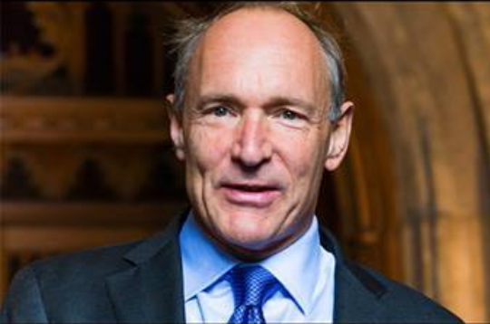
SIR PROF. TIM BERNERS-LEE