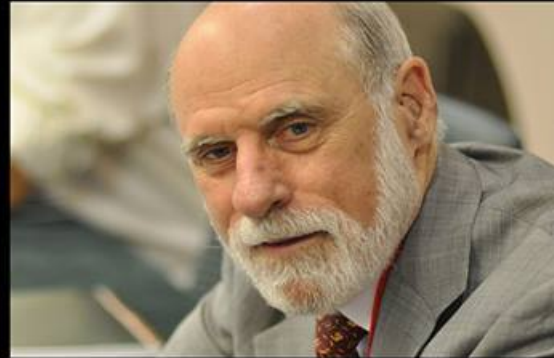
DR. VINTON G. CERF